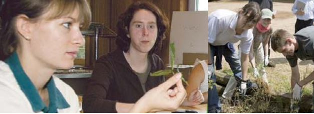
Lehramtsanwärter/innen bei der Projektarbeit