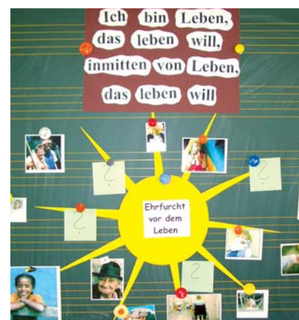
Albert Schweitzer 1923

Wie bereits im vergangenen Jahr so werden auch in diesem Jahr die Projekte in der seminareigenen Zeitung (Der Fahrtenschreiber) dokumentiert. Wer in schulischen oder außerschulischen Bildungseinrichtungen tätig ist, findet dort zahlreiche Anregungen. Exemplare des Fahrtenschreibers 2006 und 2007 können gegen eine Schutzgebühr von jeweils Euro 2,50 beim Deutschen Albert-Schweitzer-Zentrum angefordert werden. ■