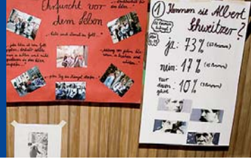
Dokumentation der Bürgerbefragung: Immerhin können 73% der Befragten etwas mit dem Namen Schweitzers verbinden.