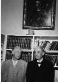
Die zur Ausstellung erschienene Broschüre über die Verbindung Schweitzers zu Leben und Werk Goethes ist im DASZ erhältlich