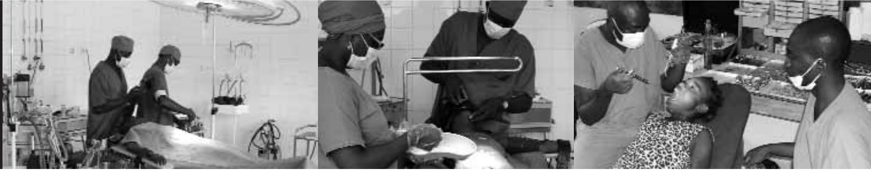
Bild rechts: In der Zahnklinik

Assistentin in Straßburg. Wie bereits in den vergangenen Jahren machte die amerikanische Schweitzer-Fellowship keine großen finanziellen Zusagen, erklärte sich aber bereit, nach Mitteln für verschiedene Projekte zu suchen.