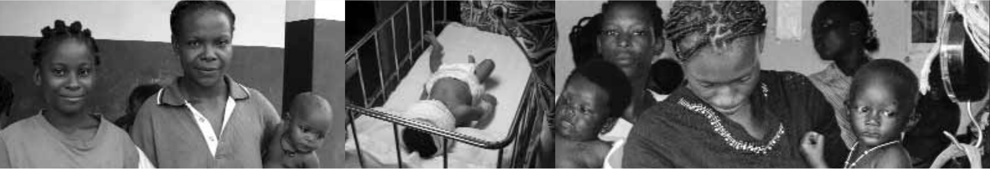
Einblicke in den Alltag der Kinderklinik