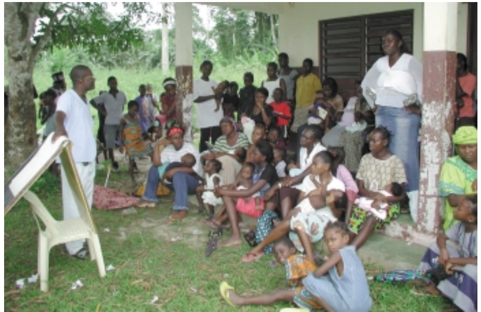
Gesundheitserziehung durch einen Krankenpfleger des Spitals vor einem Gebäude der Buschambulanz