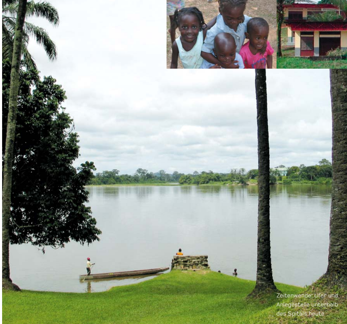
Zeitenwende: Ufer und Anlegestelle unterhalb des Spitals heute