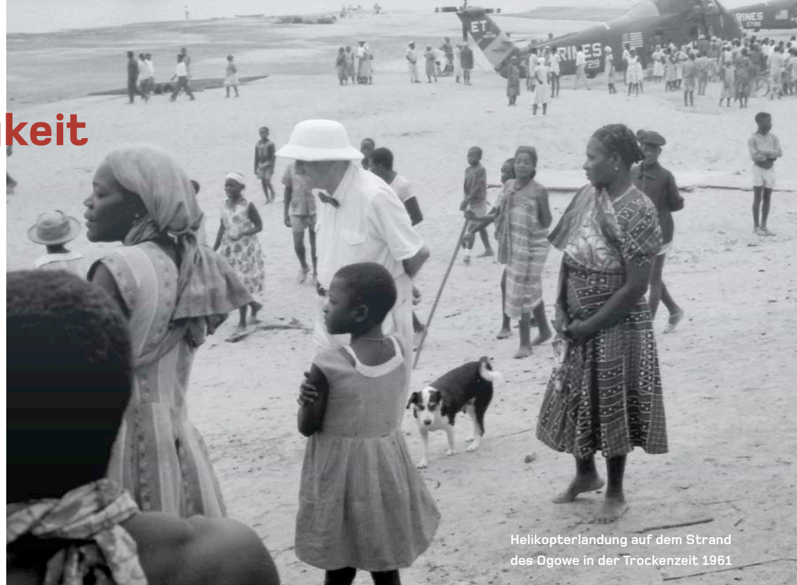
Helikopterlandung auf dem Strand des Ogowe in der Trockenzeit 1961