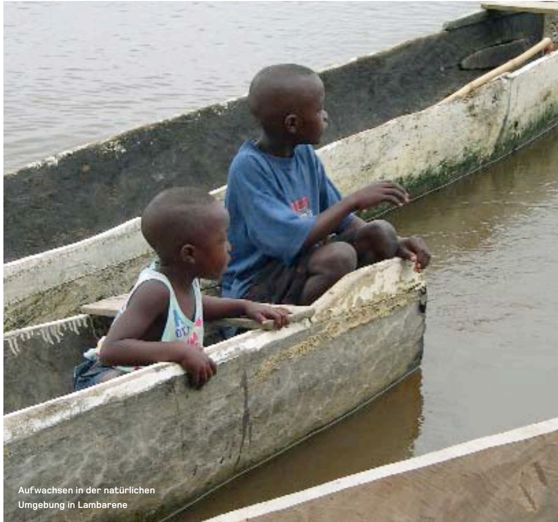
Aufwachsen in der natürlichen Umgebung in Lambarene

Antiserum verabreicht und der Patient zur weiteren Beobachtung stationär aufgenommen. Zwei Tage später war klar, dass es glücklicherweise keine Giftschlange gewesen war, und der Patient konnte entlassen werden. Natürlich waren alle froh, dass es so glimpflich abgelaufen war, aber auch darüber, dass das System der Luftrettung funktionierte. Denn in solchen Fällen kommt es auf die Schnelligkeit an. Ein Gegenbeispiel hatte das Spital einige Monate vorher erlebt. Im Nachbarort war ein Mann von einer Giftschlange gebissen worden und hatte sich zunächst einem traditionellen Heiler anvertraut. Als sich sein Zustand verschlechterte, brachte man ihn ins Regierungskrankenhaus von Lambarene, wo man ihm aber nicht helfen konnte und ihn „zu Schweitzer“ schickte. Leider zu spät, denn der Mann verstarb dort kurz nach der Einlieferung.