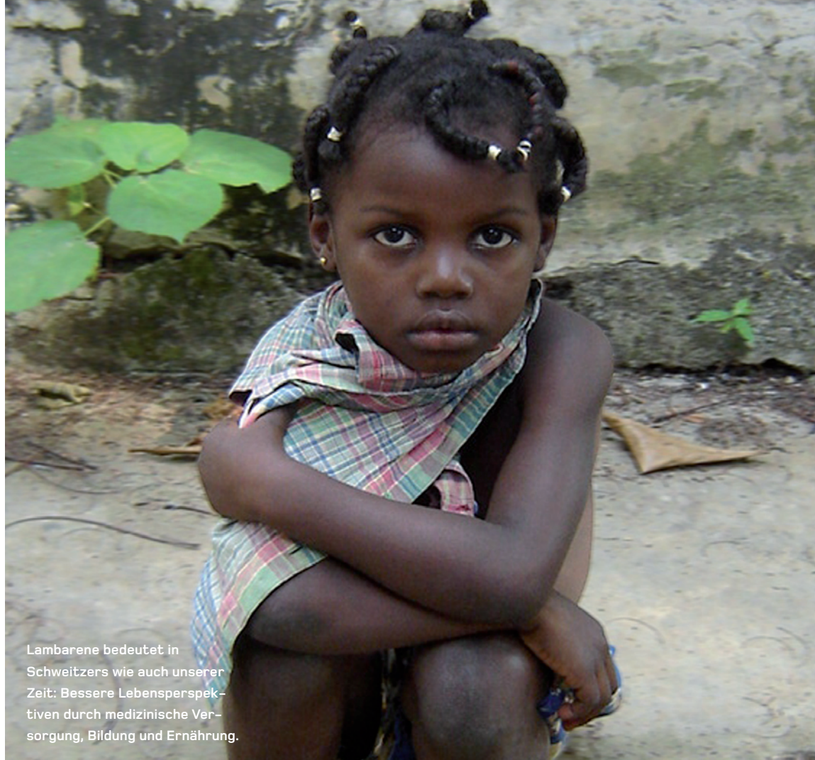
Lambarene bedeutet in Schweitzers wie auch unserer Zeit: Bessere Lebensperspektiven durch medizinische Versorgung, Bildung und Ernährung.

So weit die beiden Initiatoren des Projekts. Ich bin sicher, dass für dieses schöne und mit bescheidenen Mitteln in Gang zu setzende Vorhaben unter den deutschen Albert-Schweitzer-Freunden sich die notwendige finanzielle Unterstützung finden lässt.