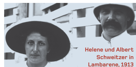
Helene und Albert Schweitzer in Lambarene, 1913