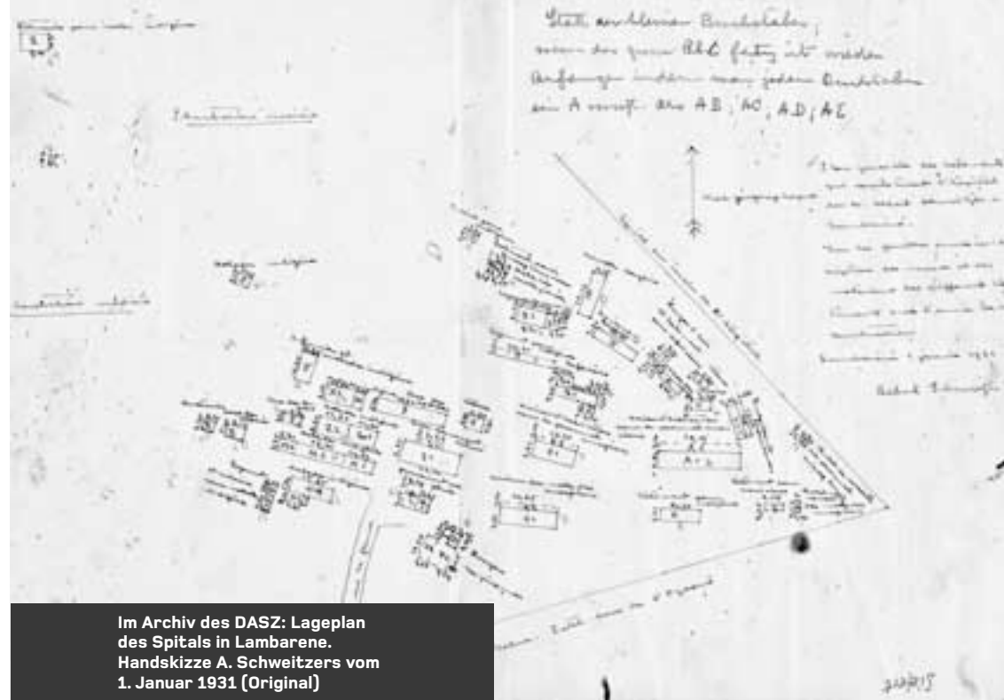
Im Archiv des DASZ: Lageplan des Spitals in Lambarene. Handskizze A. Schweitzers vom 1. Januar 1931 (Original)

Neben seiner Aufgabe, die vorhandenen Archivalien für die Nachwelt zu erhalten und das Leben und Werk Albert Schweitzers zu dokumentieren, besitzt das Archiv eine wesentliche Funktion: es stellt die Grundlage für eines der Satzungsziele des DHV, für die Pflege und Verbreitung des geistigen Werkes Albert Schweitzers in der Öffentlichkeit, insbesondere in der Jugend, dar. So werden Recherchen bearbeitet und die Materialien zu verschiedensten Themen zusammengestellt, die beispielsweise von Schulen für Projektveranstaltungen, Lehrern, Schülern oder Pfarrern für den Unterricht, aber auch von Filmgesellschaften, Verlagen sowie für die Verfassung von wissenschaftlichen Arbeiten angefragt werden.